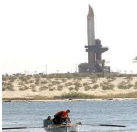
النصب التذكارى فى الإسماعيلية (لوحة ١٠) مبنى الإرشاد القديم فى شارع صلاح سالم