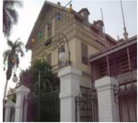
(لوحة ٦) متحف ديلسبس في الإسماعيلية