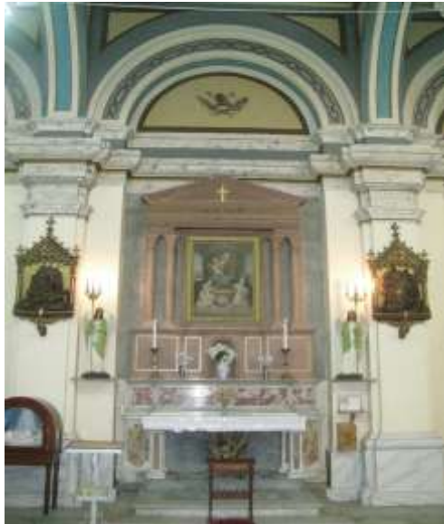
(لوحة ١٤) الجناح الأيسر في كنيسة اوجيني