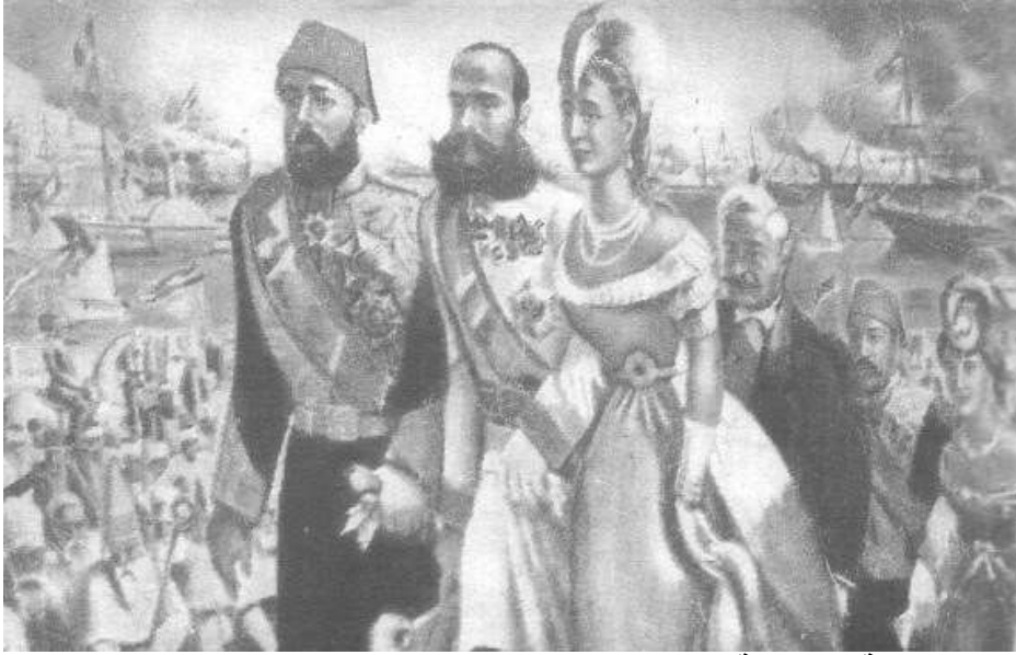
(لوحة ٢) الملكة اوجيني والخبوي إسماعيل والامبراطور نابليون