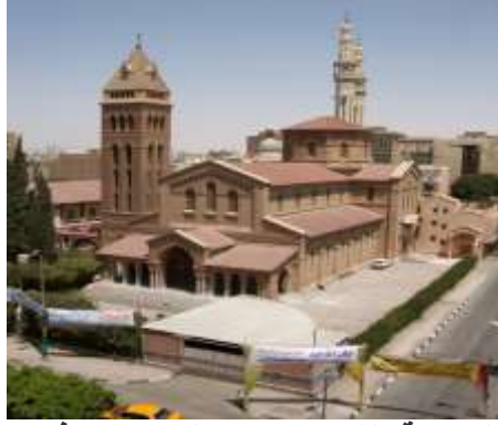
(لوحة ٥) الكنيسة الفرنسية في حمراء في الإسماعيلية