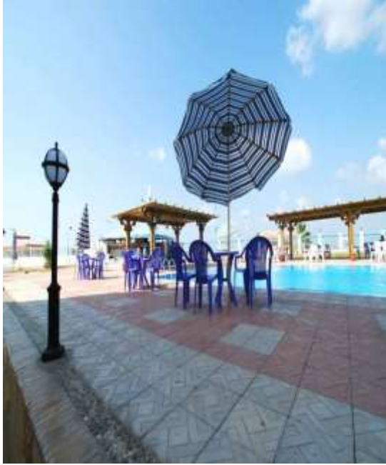
(لوحة ٢٢) قرية النورس في بورسعيد