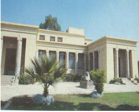
(لوحة ٧) متحف الآثار في الإسماعيلية