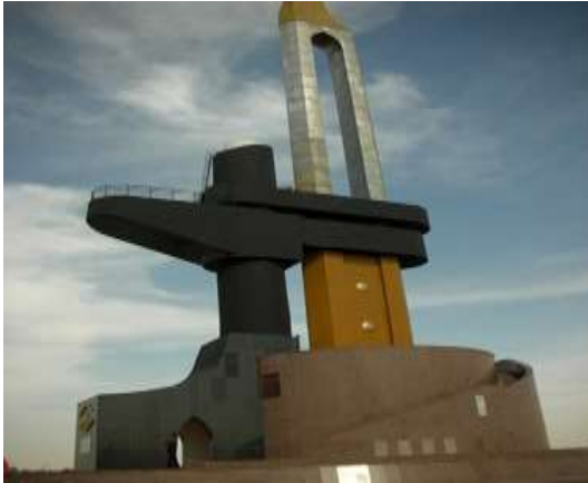
(لوحة ٩) النصب التذكارى في الإسماعيلية