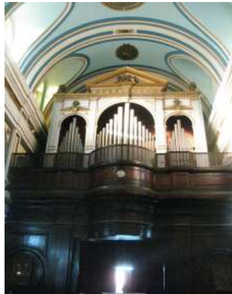
(لوحة ١٣) الجناح الأيمن في كنيسة أوجيني في بورسعيد