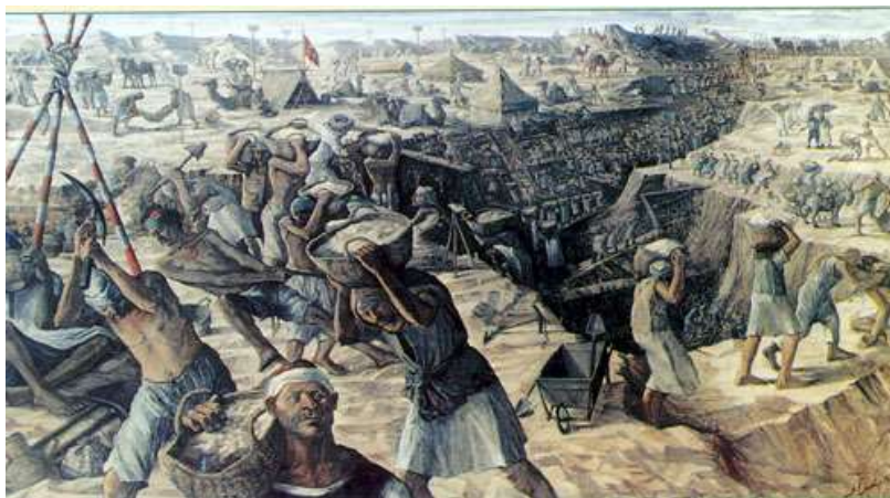
لوحة (١) صورة للعمال المصريين أثناء الحفر