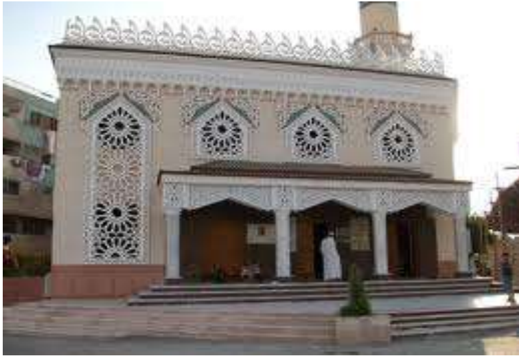
(لوحة ٤) الجامع العباسي في الإسماعيلية