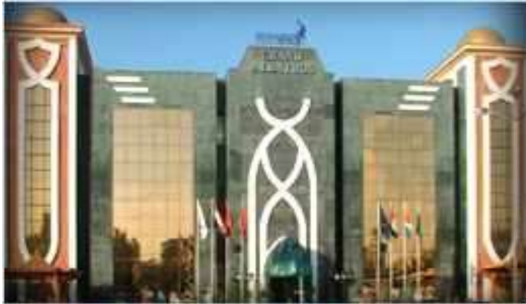
(لوحة ٢٣) فندق الباتروس في بورسعيد