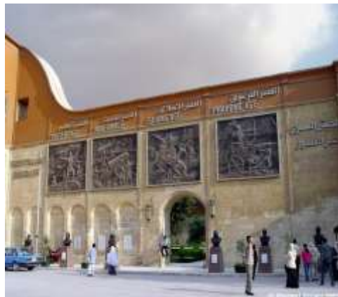
(لوحة ١٩) المتحف الحربى في بورسعيد