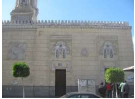
(لوحة ١١) جامع العباسي في بورسعيد