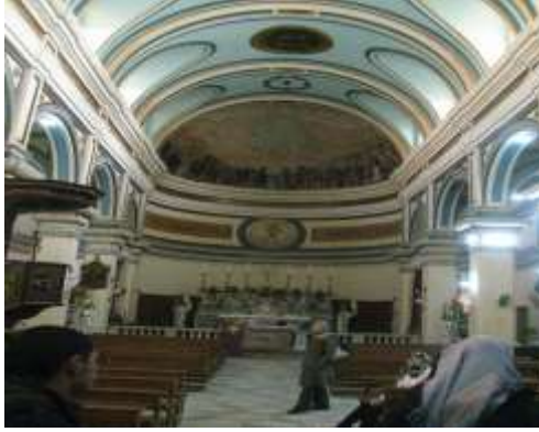
(لوحة ١٢) الجناح الأوسط في كنيسة أوجيني في بورسعيد

(شكل ٢) خريطة توضح معالم بورسعيد وموقع بورفؤاد في قارة آسيا