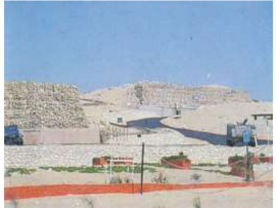
(لوحة ٨) تبة الشجرة في الإسماعيلية