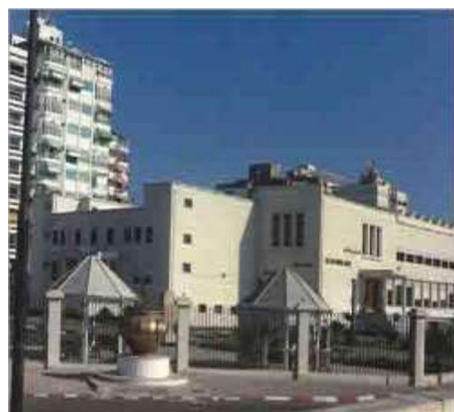
(لوحة ١٨) المتحف القومي في بورسعيد