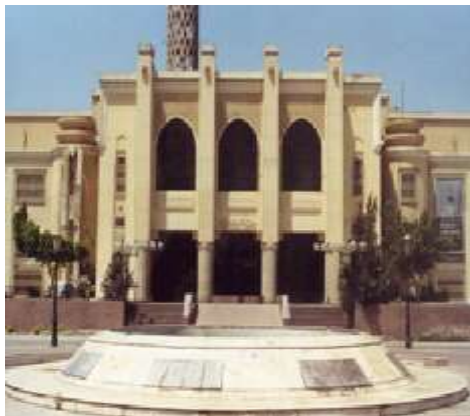
(لوحة ٢٠) متحف النصر للفن الحديث في بورسعيد