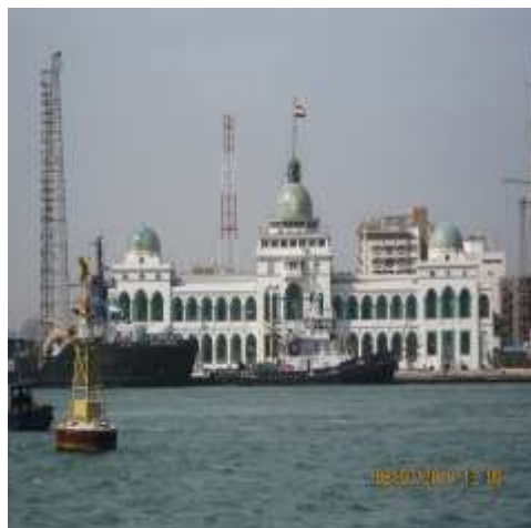
(لوحة ١٥) مبنى هيئة قناة السويس "القبة"