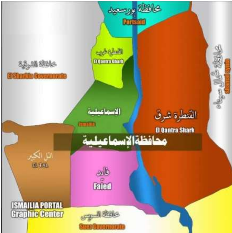
(شكل ١) خريطة توضح الموقع الجغرافى لمحافظة الإسماعيلية

تعانى مدينة السويس من تجاهل المسؤولين تجاه التراث المعمارى النادر للمنازل، والمساجد والقصور والكنائس التى يجب الحفاظ عليها، فهى فى أمس الحاجة للعناية بتراثنا وتاريخنا فيجب تحويل المدينة إلى مزار سياحى عالمى لأنها تتمتع بموقع جغرافى هام .